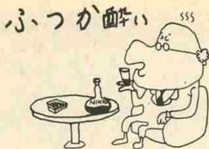
自分のからだ相談のこと

二度あると思えます。 ふつか酔いとは、前日酒を飲み過ぎて、頭痛、吐きけ、食欲不振、全身倦怠などを起こすもので、これをたちまち霧散させるような特効薬はありません。 予防はなんといつても飲み過ぎないようにするのが第一です。 また、強い酒を多量に飲まず、十分水分もとるようにし、必ずおかずを食べ、酒だけ飲むといったことを避けるなど心がけます。予防薬と称するものを服用してもあまり役に立ちません。 ふつか酔いは、アルコールによる急性胃腸炎、アルコールの代謝