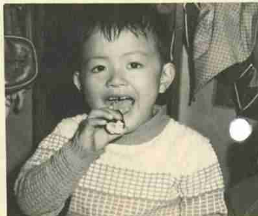
「いくつ口に入れば気がすむの?—」「あんまりおいしいから、つい手が出ちゃうのさ!」