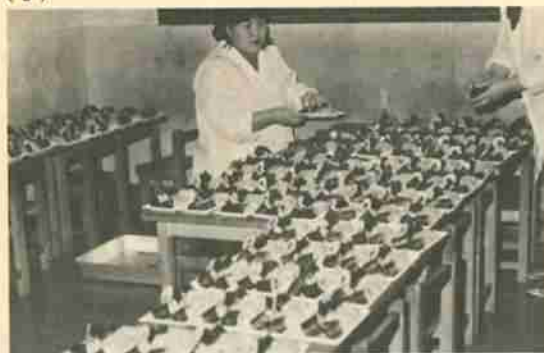
おいそうに出来あがったお寿しがたくさん/ ちよつとつまんでみたくになりますね