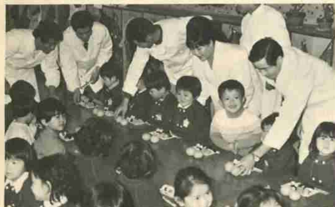
「こういうことがいつもあるといいな! おじさんたちまた来てよね?」