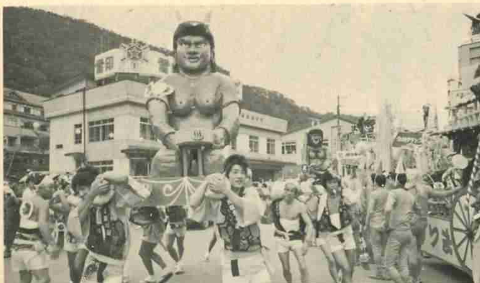
地獄まつり大パレードは、鬼みこしを中心に市内四地区を派手にねり歩き祭りのムードを盛り上げました。