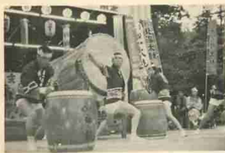
勇壮なバチさばきで人気をあつめた北海道太鼓まつり。