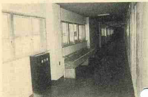
各廊下には衛生上から手洗い場が設けられています。また火災予防のため火災報知器と消火栓設備をして、児童の安全をはかっています。

昨年から工事を進めていた鷺別小分校分教場は、第一期工事も終り、校名を若草小学校として生徒を待つばかりとなりました。 この若草小は梶別東小につぐ、管内一を誇るモデル校で、入学式は四月七日におこなわれ、新入学児童と鷺別小学校からの転校生をあわせて三六八名でスタートします。