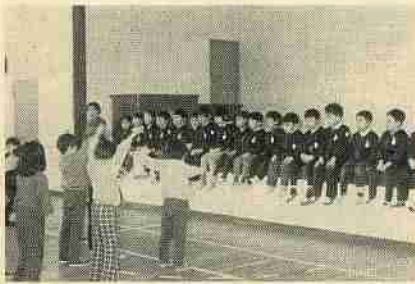
学校を見学する 市内幼稚園児

このように、子どもが心身ともに健康で、楽しみに学校生活にスタートするということを、たいせつにしてあげましょう。