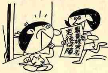
農協で1日から受付けます

営者で、国民年金に加入している経営主はかならず加入しなければならぬこととなります。しかし、将来農業を続けられなにかたなどは、申出により加入することを免除してもらえます。 《希望により加入できる人》 農地面積が二畝未満でも（二畝以上で、希望によって加入できます。この場合でも、国民年金の加入者であることが必要です。また、将来農業経営者となる、あと継ぎのかたも、同じ条件で加