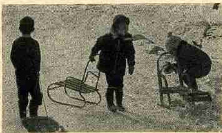
元気に遊ぶこどもたち

ともすれば、くずれやすく、事故のおきやすい冬休みの生活を、楽しく、豊かで明日の生活の糧となるよう過ごさせたいものです。