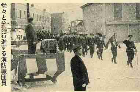
堂々と分列行進する消防職団員