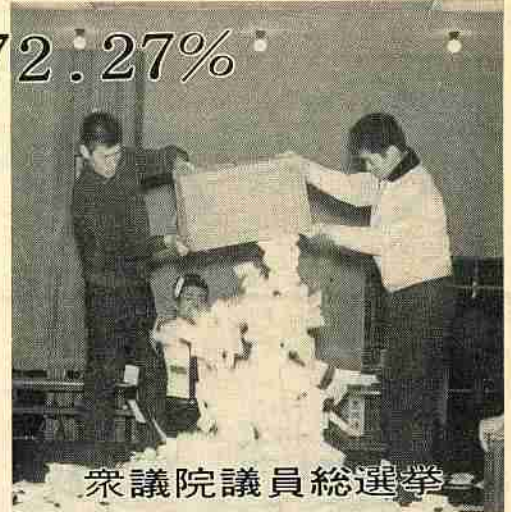
衆議院議員総選挙