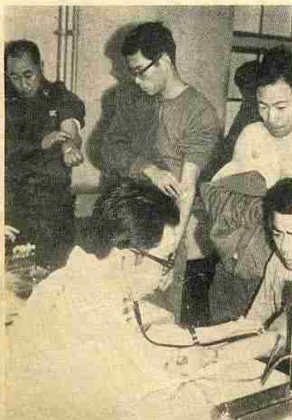
多くの隊員が献血に協力いただきました