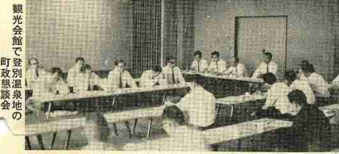
観光会館で登別温泉地の町政懇談会

汲取業務を円滑におこなうため連日けんめいな努力をしておりますが、便槽の中に衣料やその他の異物を投げ入れると、汲取車、その他し尿消化槽処理のとき、機器等の故障や不便がありますので、みなさんのご協力をお願いします。なお、汲取の際、これらの混入を発見した場合、家人に異物を処してもらってから汲取りします。