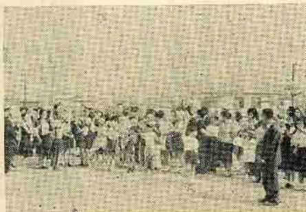
校庭での安全祈願祭

引続き校庭で「安全の願い」と書いたカードをゴム風船につけ、快晴の上空に一斉にはなし、なき友へとくまで見守り、今後犠牲者を出さないことを安全宣言しました。その後、遺族を囲み、今後の事故防止について座談会が開かれ、意義深い全日程をおえました。