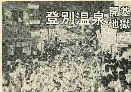
昨年行なわれた鬼踊り大群舞

登別温泉は、こゝしで満百十周年を迎え、これを記念して、八月二十五日午後二時より百十周年記念の式典とクツタラ湖循環道路完成式典、午後四時よりクツタラ湖環状道路一周マラソンがおこなわれます。