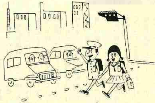
新入学児童を車の事故から守ろう

家庭、学校（幼稚園）では、こどもの通学道路をきめて、その途中の交通のきまりをよくおぼえさせ、道路の安全な歩き方をしつけてください。