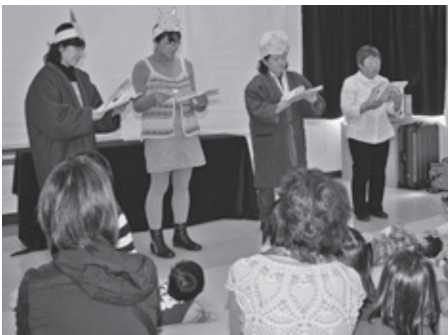
▲読み聞かせ『おこんじょうり』を聞く子どもたち