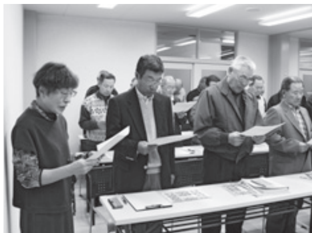
▲市民憲章を唱和する参加者

今年は、各地区連合町内会から提出された防災対策や川の管理などのテーマのほか、各地区のまちの将来像について、活発な意見交換を行いました。