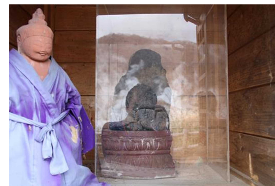
ケース内にある観音像、左は復元像