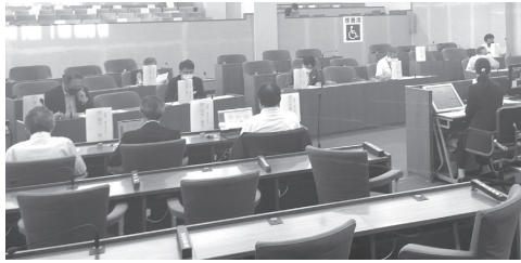
▲「持続可能な開発目標(SDGs)を登別市のまちづくりに生かす条例」に係る意見交換会の様子

この中で条例案に関しては、総じて幅広い内容が網羅されており、特に問題となる項目などはないとの意見をいただいたことから、最終調整を進めており、登別市議会パブリックコメント実施要綱により、広く市民の皆さんに公表し、意見などに対する考え方や検討結果を伝えていく予定としています。