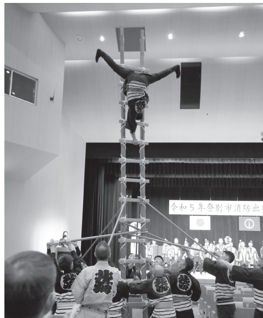
▲はしご乗りの様子

1月7日、市民会館で令和5年登別市消防出初式を行いました。 屋外会場では、消防職員と消防団員が、一糸乱れぬ足取りで分列行進を実施。屋内会場では、西胆振畜土木工事業連合組合がまといふり、木やり歌、はしご乗りを披露し、会場は拍手に包まれました。 また、各種表彰も行われ、参加者は防火・防災への意識を新たにしています。