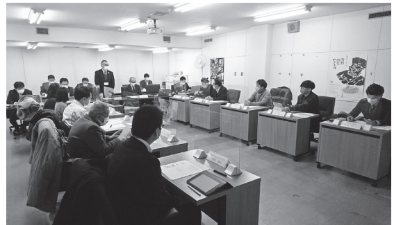
▲ワーキンググループの様子

協議の内容については、市公式ウェブサイトの専用ページ（新しい市役所本庁舎整備事業）に掲載していきますので、ぜひご覧ください。