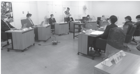
▲議会サポーターとの意見交換の様子

今回の意見交換会は、令和5年3月予定の本格運行のための一助になると考えられています。(小栗)