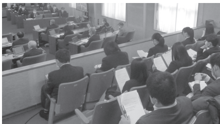
▲令和4年12月8日 青嶺高校の議会見学の様子

翌週には、議場で実際に市議会議員が質問する様子を見学いただきました。市議会に限らず、学生の皆さんが地元企業や団体とつながるなかで、登別への愛着を育み、将来の進路を考える本授業は、とても有意義なものです。私たち市議会にとっては、学生の皆さんから新たな価値観を学ぶ機会になつており、これからも積極的に企画していきたいと思えます。(辻)