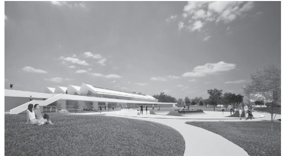
▲基本設計説明書（案）の一部