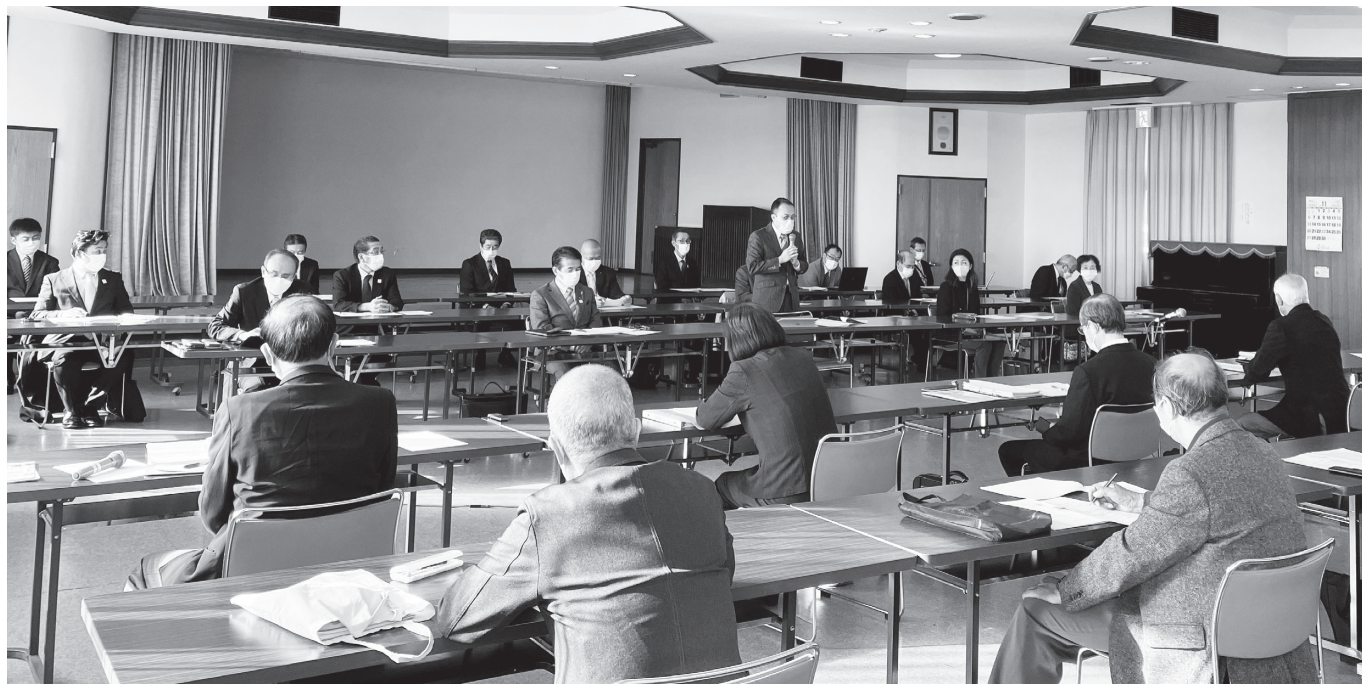
▲令和4年11月22日 連合町内会との意見交換会の様子