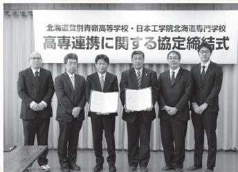
▲協定締結式の様子