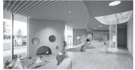
▲子育て支援エリアのイメージ