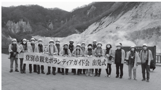
▲登別市観光ボランティアガイド会の皆さん