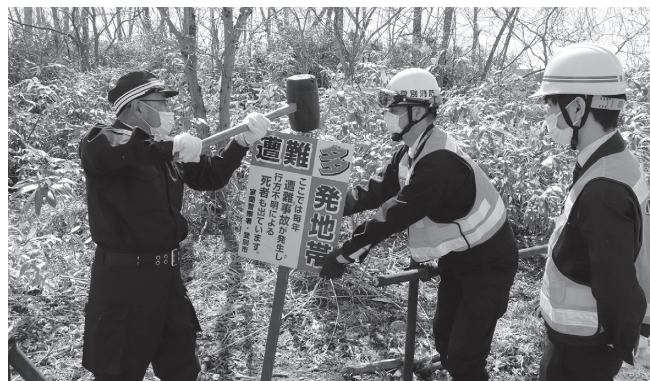
▲遭難防止看板を設置する職員