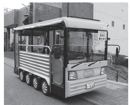
▲低速電動バス 『グリーンスローモビリティ』

市は、これからもゼロカーボンシティの実現へ向けて、その取り組みなどについて市民の皆さんにお知らせしていきます。