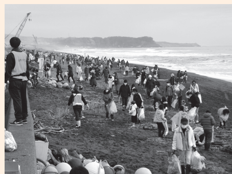
▲幌別エリアの海岸沿いの清掃の様子