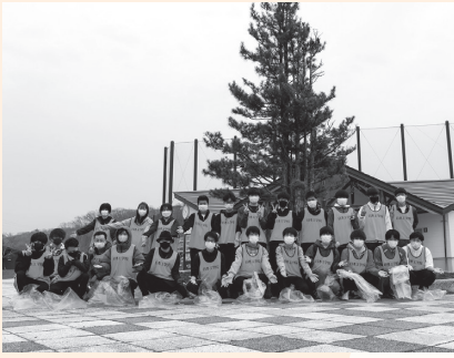
▲クリーン作戦に集まった学生

学生たちは、朝の7時前に岡志別の森運動公園に集合し、そこから『千歳寮』方面と『ほろべつ寮』方面の二手に分かれ、道路沿いに捨てられたゴミを、一生懸命に拾い集めました。