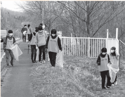
▲クリーン作戦の様子