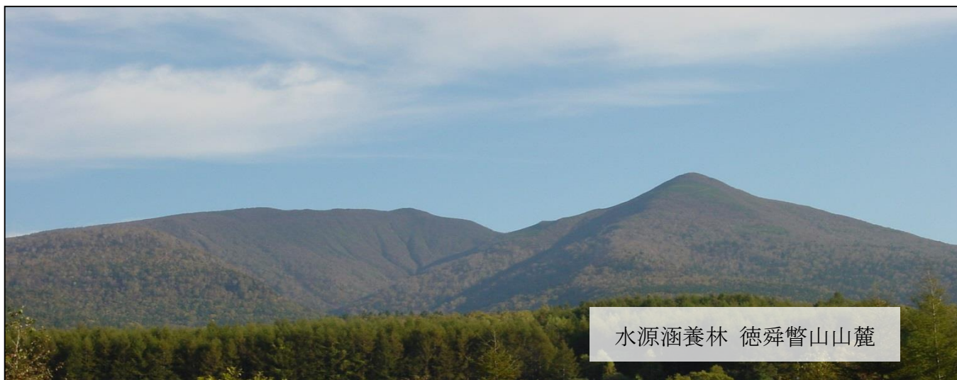
水源涵養林 徳舜瞥山山麓

■ 現状 水源涵養機能を有する森林は、上水道の供給源である水源を守り、育むために必要不可欠ですが、近年、全国各地で水源涵養林を含む森林の買収が相次ぎ、大きな社会問題になっています。 現在、多くの自治体で水資源を保全するための条例が施行・検討されていますが、かけがえのない国土を守るためには国全体での取り組みが必要です。