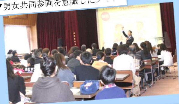
▼クイズで元気よく手を挙げる親子