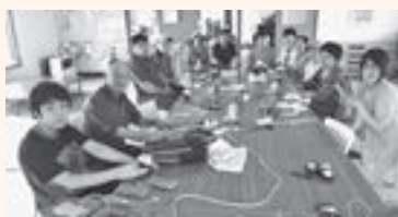
▲憩いの場にもなった充電サービス

一方で、災害時の連絡体制や非常用発電機の燃料確保など、課題も見つかったので、次の災害に備えて、早急に話し合っていきたいと思えます。