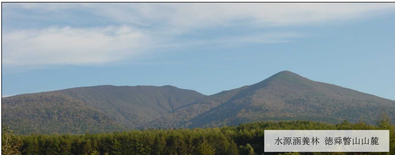
水源涵養林 徳舜瞥山山麓

■ 現状 水源涵養機能を有する森林は、上水道の供給源である水源を守り、育むために必要不可欠ですが、近年、全国各地で水源涵養林を含む森林の買収が相次ぎ、大きな社会問題になっています。 現在、多くの自治体で水資源を保全するための条例が施行・検討されていますが、かけがえのない国土を守るためには国全体での取り組みが必要です。