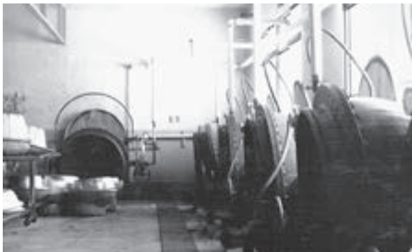
▲学校給食センターの作業室（建築当初）

小・中学生のときの楽しみの一つである学校給食。学校給食センターで調理し、市内の全小・中学校に配送される