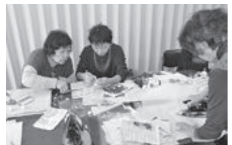
▲手先を器用に使いながら、作業を進める会員

「染料となる色の付いたマットとアイロンがあれば、簡単に染めることができます。あとは、好きな形に染まるよう、自分の気に入った花や葉っぱを見つけて使用したり、切り絵やちぎり