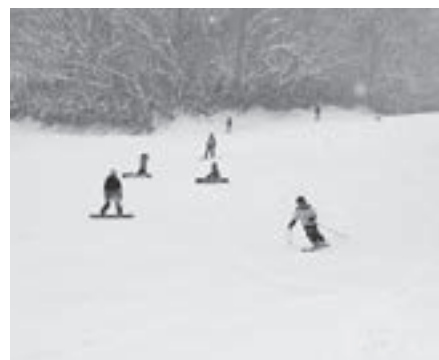
▲スキーヤーやスノーボーダーでにぎわうゲレンデ

今季の営業は、3月21日(水)までを予定しており、営業時間は9時から16時までとなっています。