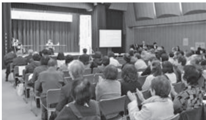
▲聴覚に障がいのある人に向けて、講演内容をスクリーンに映し出すなどの配慮がなされた会場