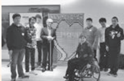
▲「障害者週間」記念事業で、来場者と共に完成させたペットボトルキャップアート

たを使ったキャップアートのサポートなどを行いました。同校としても、学生委員会の活動をサポートしながら、平成30年も引き続き、地域に根ざした学校運営に努めていきます。 1月のオープンキャンパス+体験入学 学科ごとに行われる多彩な種類の体験や設備の見学などをしてみませんか。 日時 ・1月20日(土) 11時~14時30分 ・1月28日(日) 10時~14時30分 問い合わせ 入学広報室 (☎0120-666-965)