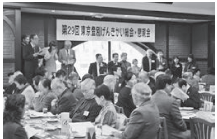
▲設立30周年に向けた役員体制などを決議した『東京登別げんきかい』の総会