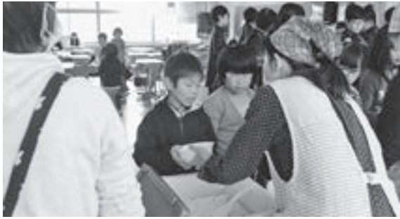
▲炊き立ての温かいごはんを受け取る児童(12月)

また、収穫したお米の一部は、登別市社会福祉協議会に寄贈され、地域福祉の推進にも役立てています。