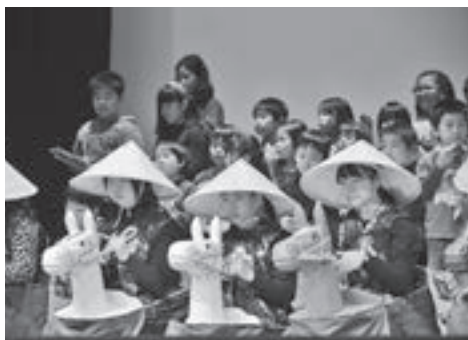
▲子どもたちの演奏に合わせて踊りが披露される、幌別東小学校の『幌別駒おどり』

私は、『幌別駒おどり保存会』へ加入し、子どもたちに『幌別駒おどり』の演奏を教えて、10年が経ちました。活動を続けてきた中で、登下校中の子どもがあいさつしてくれたり、お礼の手紙をもらったたりするなど、うれしい経験をたくさんさせてもらいました。 『幌別駒おどり』は、昭和38年に誕生した郷土芸能で、笛やすずなど4〜6種類の楽器で奏でる演奏に合わせて、子どもたちが馬にまたがって元気に駆け回る様子を表現する踊りです。平成27年に、幌別東小学校が土曜授業に幌別駒おどりを取り入れ、現在、全校児童が取り組んでくれています。平成29年には、踊りに使う『駒』や陣笠を一新し、駒を担当する子どもからは「駒が軽くなって良かった」と好評です。 私自身が中学生の時に取り組んだ合唱を今でも続けているように、子