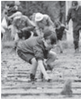
▲はだしで田んぼに入って、一つ一つ丁寧に稲の苗を植えた『田植え』(5月)