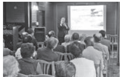
▲情報交換会で、登別市の最近の情報について真剣に耳を傾ける『東京登別げんきかい』の会員

市の魅力のPRなどに、より一層力を注いでいきたいと思えます。 また、私にとっても、今年が古希(70歳)を迎える節目の年です。私のモットー『明るく、楽しく、元氣よく』を全面に打ち出し、30周年を節目に、当会を盛り立て、会のさらなる活性化に取り組めます。 結びに、平成30年をすばらしい一年にしていきたいと思います。