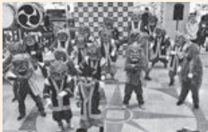
▲平成29年1月28日(土)に行われた『鬼まつり』では、市内を『元鬼ふりまき隊』(豆まき隊)として練り歩いた

日本工学院北海道専門学校の生徒で結成している学生委員会は、約10年前からボランティア活動に積極的に取り組むとともに、市民の皆さんと交流を図っています。