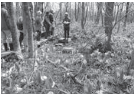
▲『ミズバショウ観察会』など、季節ごとに多様な行事が開催されるキウシト湿原

登別東町在住。64歳。 平成14年に『キウシト湿原の会』を立ち上げ、湿原の保全に尽力。現在は、湿原の管理を行っている『NPO法人キウシト湿原・登別』の理事長を務める。キウシト湿原の保全をけん引する一人。