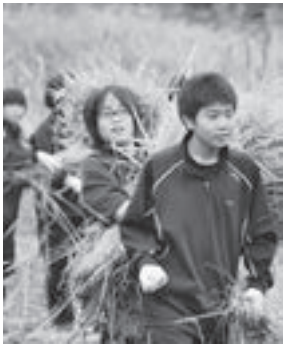
▲たわわに実った黄金色の稲穂を一齐に刈り取った『稲刈り』(10月)