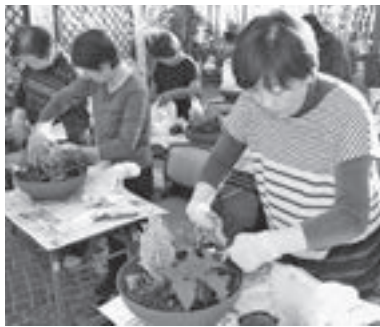
▲配置のバランスに注意しながら、思い思いに寄せ植えを仕上げる参加者

今回の講習会では、クリスマスツリーをイメージしたゴールドクレストのほか、真っ赤なポインセチアなど4種類の花を使用。参加者は、講師のガーデニングプランナー・