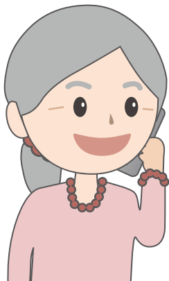
利用者・家族など