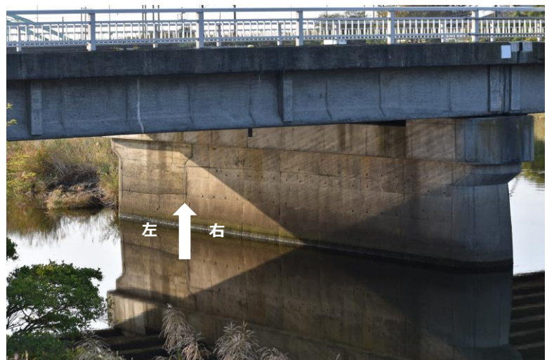
来福橋の橋脚（令和元年10月撮影）

まちを歩いていると、この橋のように過去から現在に至るまでの変遷をたどることができる場所が市内に多くあります。