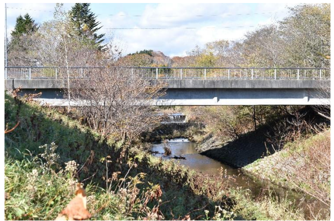
現在（右岸から撮影）

幌別浄水場（昭和37（1962）年建設）横の吊り橋付近で遊ぶ子供たちです。現在の写真と見比べると川の流れる方向が違うことに気付かれると思います。