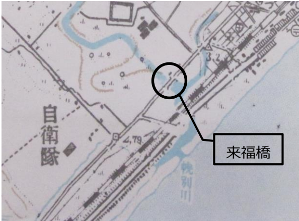
胆振幌別川付近（昭和30年代前半）

左の地図は、昭和34（1959）年に発行した「幌別町全図」の一部ですが、この地図にある橋梁5か所は、全て「木橋※」として描かれています。