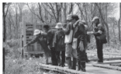
▲キウシト湿原の見学の様子