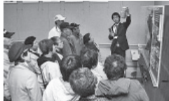
▲クリンクルセンターの見学の様子