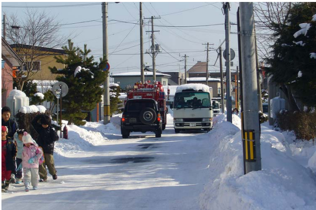
通学路としてたくさんの児童が歩行するが、歩道がなく道幅も狭いため大型車両が通行すると非常に危険である。

以上のように、本路線は幌別地区内における重要な路線であり、将来的にも交通需要が増加する状況にあることから、道道に昇格し整備していただくことを要望します。