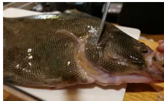
《写真》マツカワカレイ