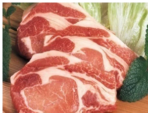
《写真》 のぼりべつ豚ロース