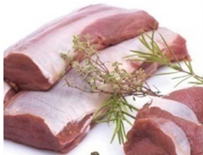
《写真》 エゾシカ肉ロース