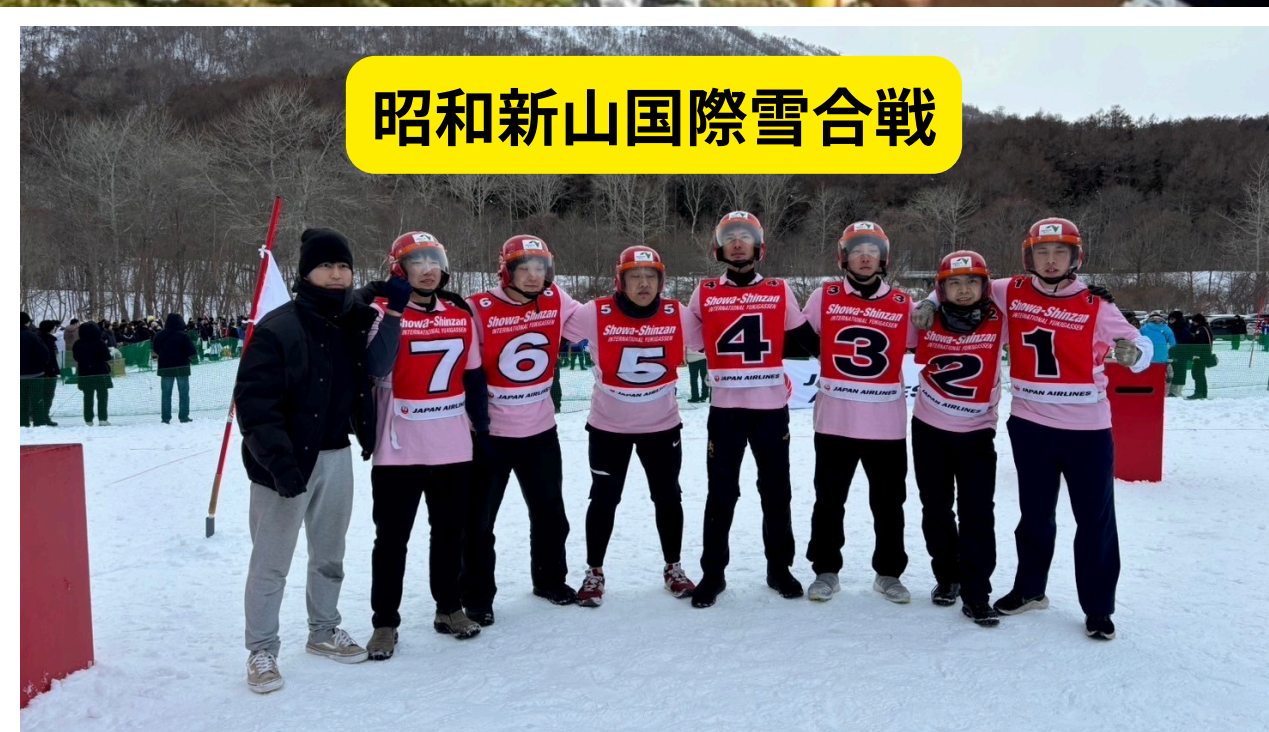
昭和新山国際雪合戦