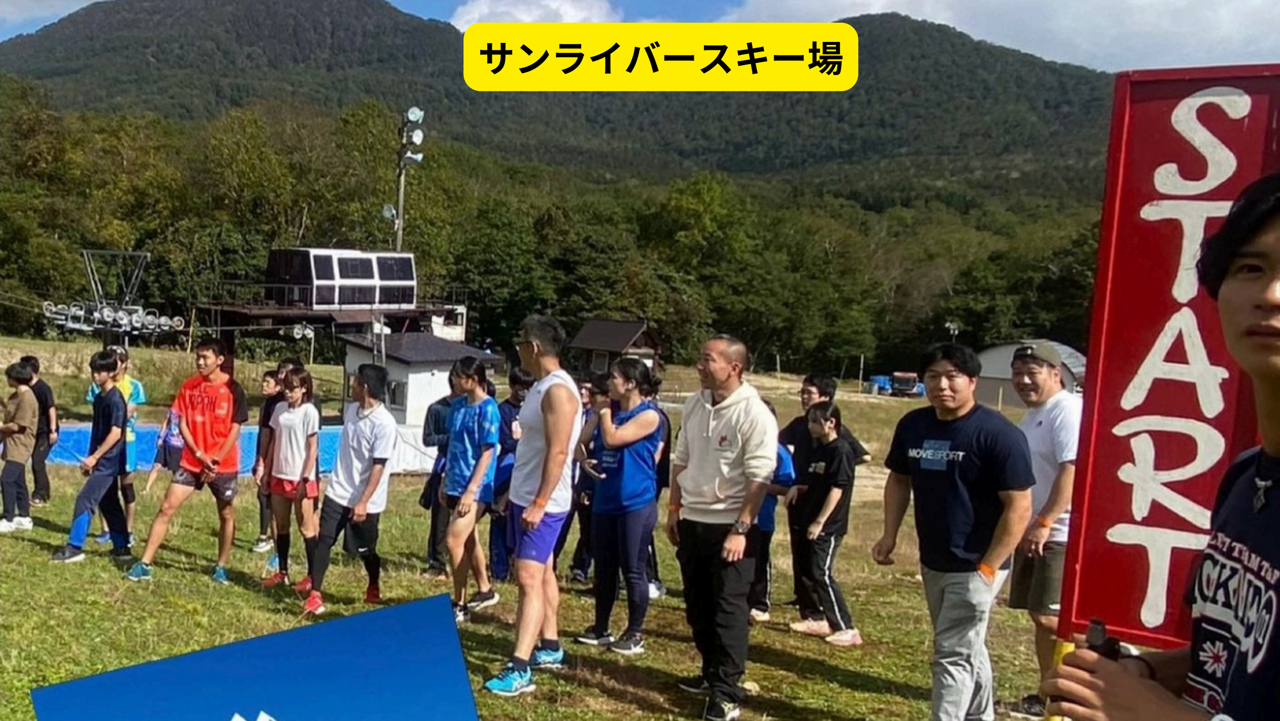
サンライバースキー場