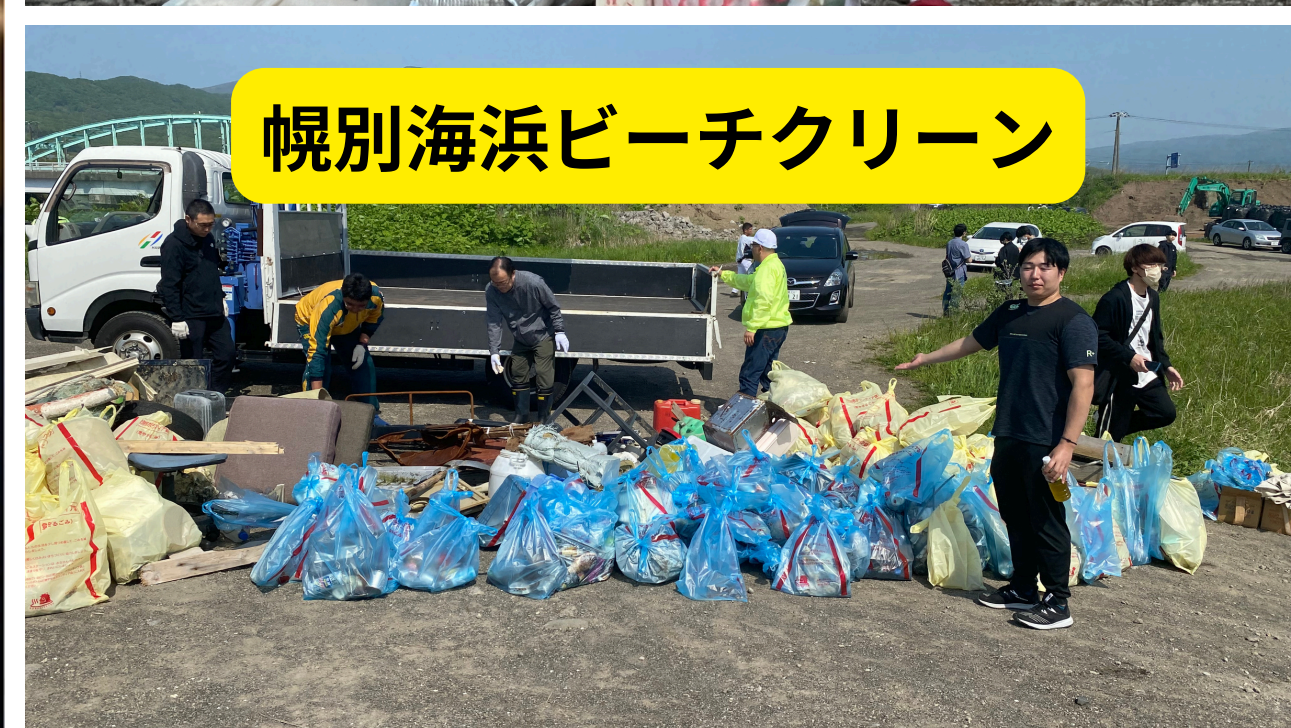
幌別海浜ビーチクリーン