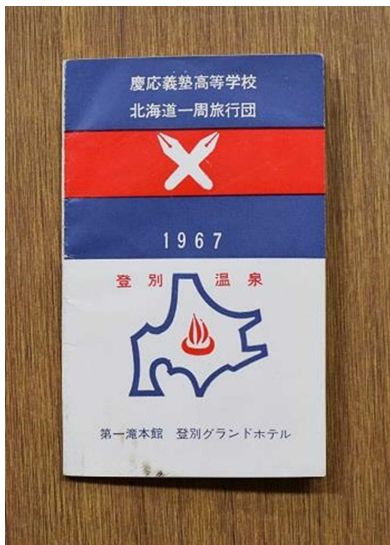
慶応義塾高等学校 北海道一周旅行団のしおり(1967年)

昭和42(1967)年7月、慶応義塾高等学校(東京都)では、上野駅を出発して8泊9日(汽車での1泊のほか、湯の川や定山溪、層雲峡、川湯、十勝川、登別温泉、洞爺湖の7か所に宿泊)の北海道一周旅行が行われました。