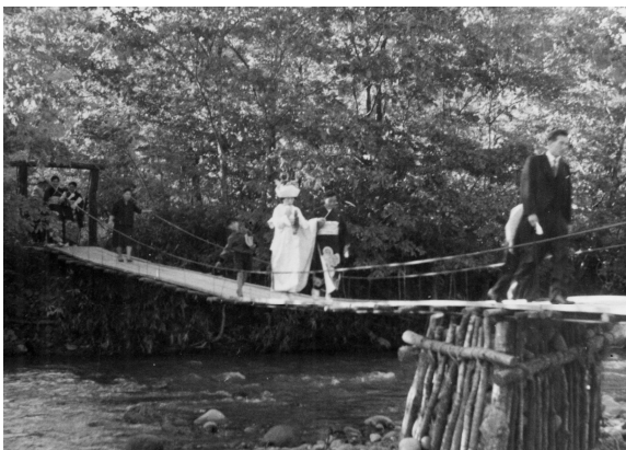
登別川の吊り橋を渡って嫁入りする花嫁（撮影年不詳）