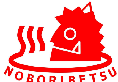
市制施行50周年記念ロゴマーク

これまでの50年を振り返り、これからの50年を考える一つの機会である市制施行50周年。新型コロナウイルスの拡大防止などのため、記念式典等は延期となっていますが、8月1日は、それぞれの方法でこの50周年をお祝いしてみませんか。