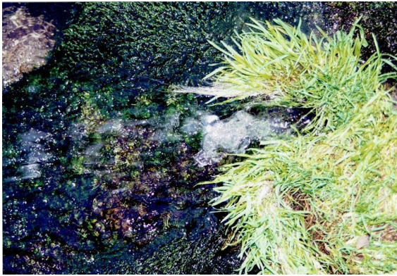
（上・下）水がわき出る様子（1999年撮影）