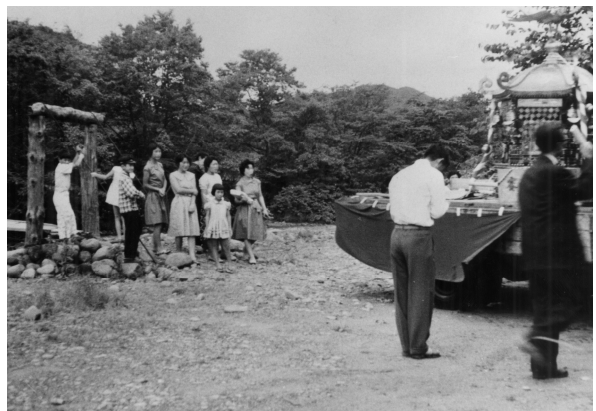
神輿渡御（吊り橋前・撮影年不詳）

登別川は、オロフレ峠付近から流れ出し、途中で登別温泉から流れ来るクスリサンベツ川をはじめとする支流を合流して、太平洋に注ぐ川です。