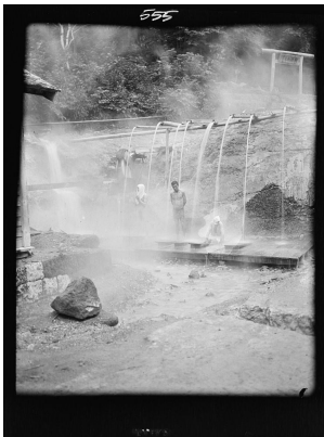
瀧の湯(明治41年)

アメリカ合衆国の写真家、アーノルド・ゲンテ(1869～1942) は、明治41(1908)年に日本を訪れ、その途次に登別温泉の「瀧 の湯」(現在の泉源公園付近)を撮影しました。