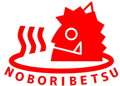
市制施行50周年記念ロゴマーク