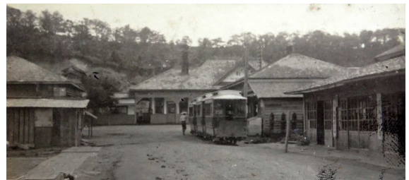
登別停車場前(大正5年)

登別駅は、昭和10(1935)年に建て替えられたた め、それ以前の姿を写すこの写真は、貴重な一枚 です。